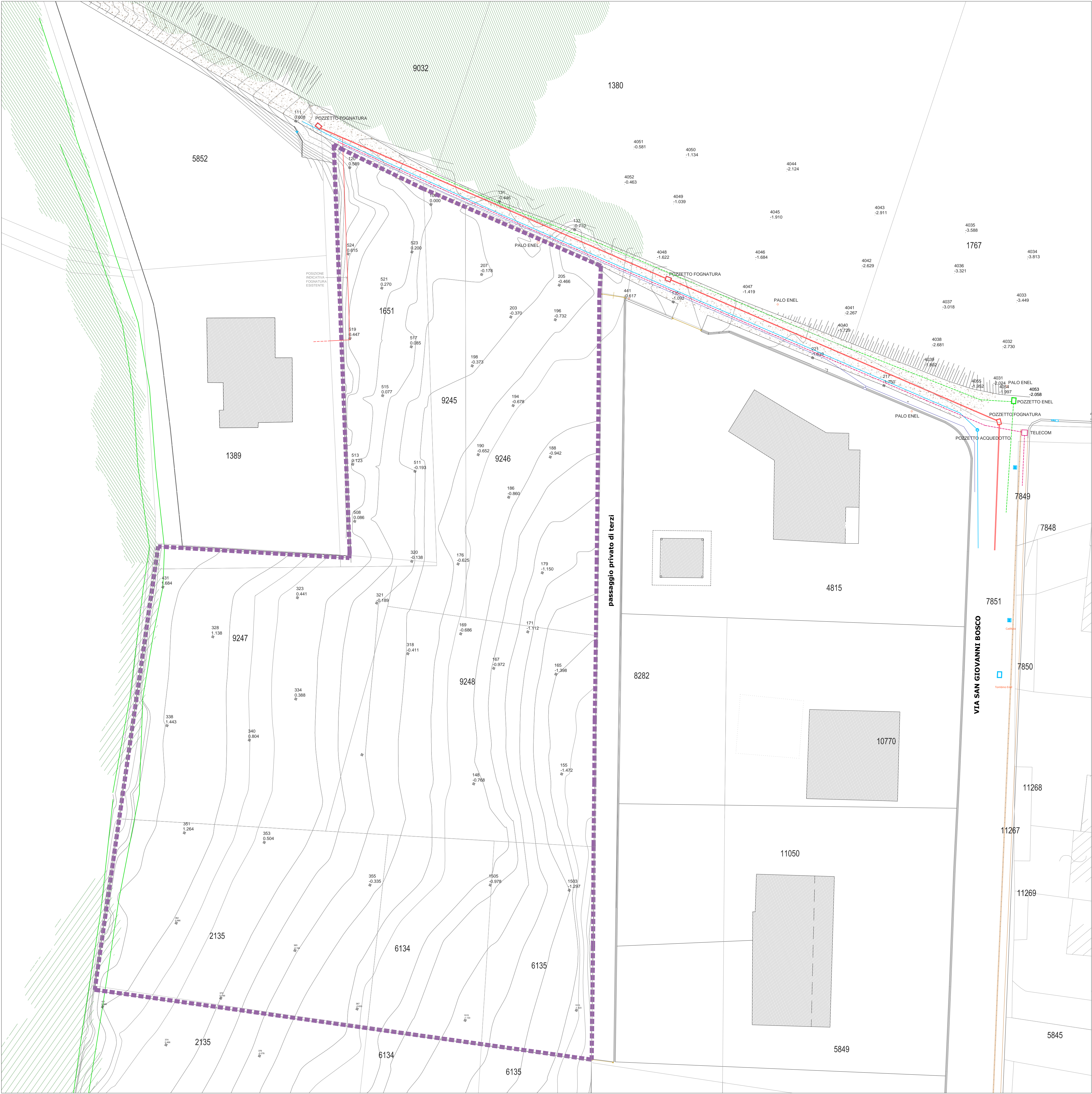
► PLANIMETRIA GENERALE SCALA 1:400