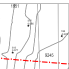
CURVE DI LIVELLO